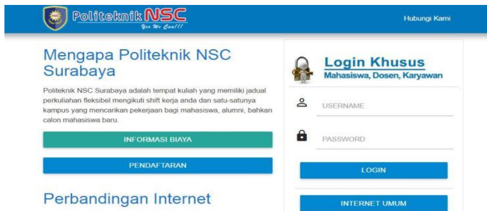
Halaman login Hotspot Politeknik NSC Surabaya

Setelah terkoneksi pada SSID maka pengguna akan diminta untuk memasukkan username dan password, username dan password dapat di dapatkan dengan cara mengirimkan email kepada NSC ICT Departemen untuk civitas akademika Politeknik NSC Surabaya. Sedangkan untuk pengunjung tetap dapat mengakses internet dengan cara memilih tombol INTERNET UMUM.